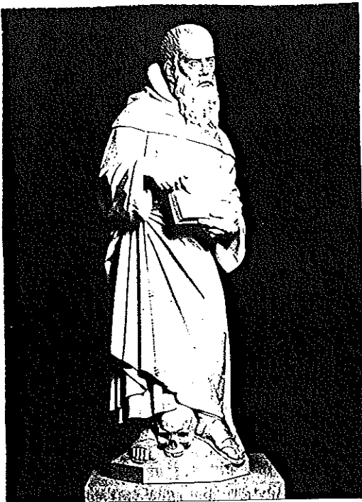
Sculpted by Andrew Tanser.