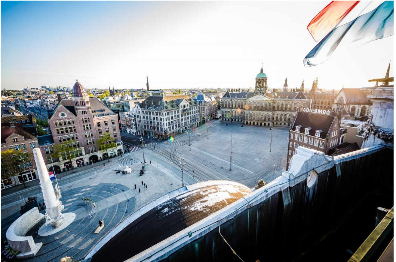
Lege Dam op 4 mei 2020: @Copyright: Comite 4 en 5 mei