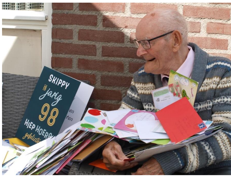
Skippy 98 in 2020!