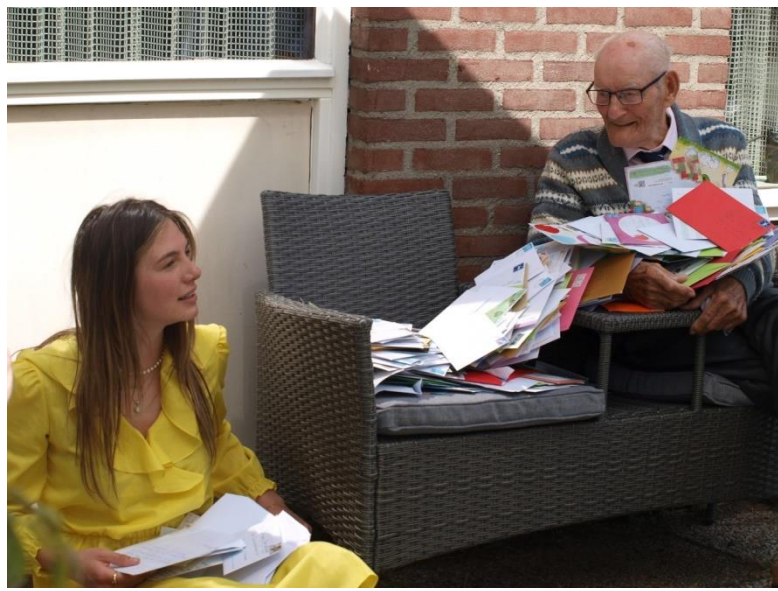
Skippy 98 onder de kaarten samen met Maan